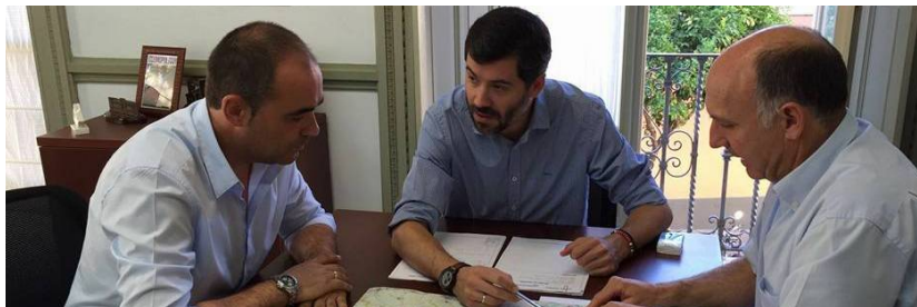
Imagen de archivo de la reunión mantenida entre el Alcalde y El Delegado de Fomento en julio de 2016.

“Desde el Ayuntamiento vamos a seguir trabajando por la mejora de las comunicaciones y el aumento de la seguridad en la carretera”, ha comendado el primer Edil, quien ha hecho alusión a que se trata de la única vía de acceso a Castilblanco, convirtiéndose el arreglo de ésta en una necesidad para el desarrollo de nuestro municipio.