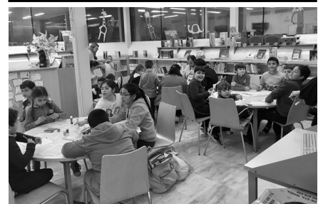
Imagen del "Taller de Decoración Navideña," celebrado este lunes en la Biblioteca Municipal.

A la X Carrera Popular y los diversos mercadillos locales, también se sumará la Asociación Cultural Deportiva Cristo de los Vaqueros con su XVI Marcha Hípica y su V Gymkhana Hípica, a celebrar este domingo. Los participantes deberán concentrarse en el Recinto Ferial entre las 9:30 y 10:00 horas de la mañana.